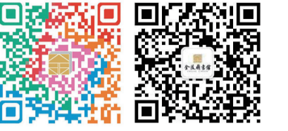
阅美至善 金陵微信