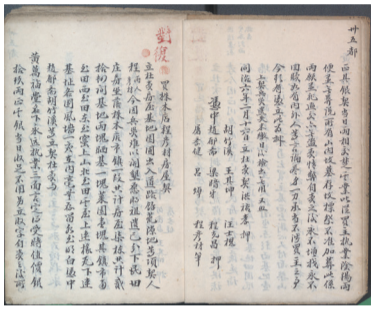
【宁国】《黄安福堂契约文书合集》五十三页（清）赵郁斋书 清同治六年（1867）赵郁斋抄本 宣城市图书馆

该合集所收录的原始民间文书，完整展现了清代宁国县民间产业交易的真实图景。契约详细记载了黄安福堂购置产业的具体事宜，涵盖交易双方信息及田地、山场、房屋、水塘的